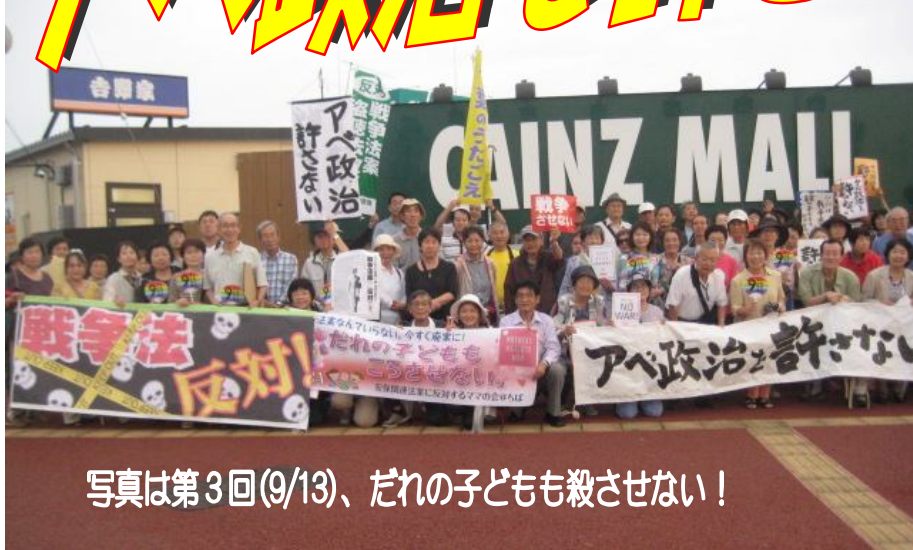
写真は第3回(9/13)、だれの子とも殺させない！

戦争法案は9月19日未明、参議院でも強行採決で成立させられました。しかし、これは平和憲法・立憲主義を否定し、民主主義を破壊する暴挙です。私たちはこれを認めることはできません。